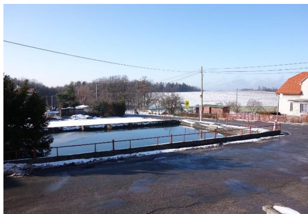
Požární nádrž na křižovatce

V letech 1958-59 zakoupili požárníci od n.p Tepna Náchod starší automobil zn. Mercedes upravený pro požární účely, v roce bylo 1961 přiděleno další vozidlo zn. Mercedes na náhradní díly, ale i po úpravách a opravách bylo toto vozidlo stále poruchové.