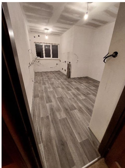
Koncem listopadu začala montáž nového nábytku pro knihovnu a kancelář.