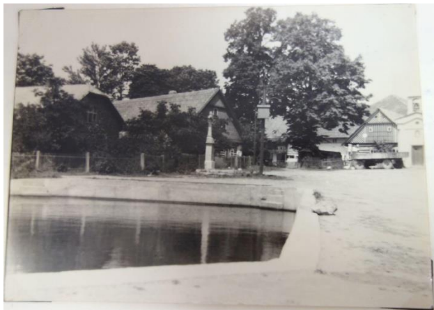
Požární nádrž na návsi